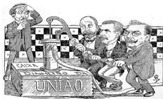
Charge ironiza as manobras econômicas para proteger o café e os cafeicultores