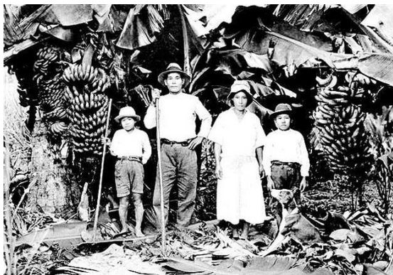
Imigrantes japoneses chegaram ao Brasil a partir de 1908