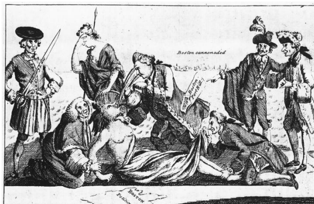
The able Doctor, or America swallowing the Bitter Draught.