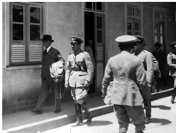
Washington Luiz conduzido ao exílio na Europa, de onde só voltaria após a queda do Estado Novo