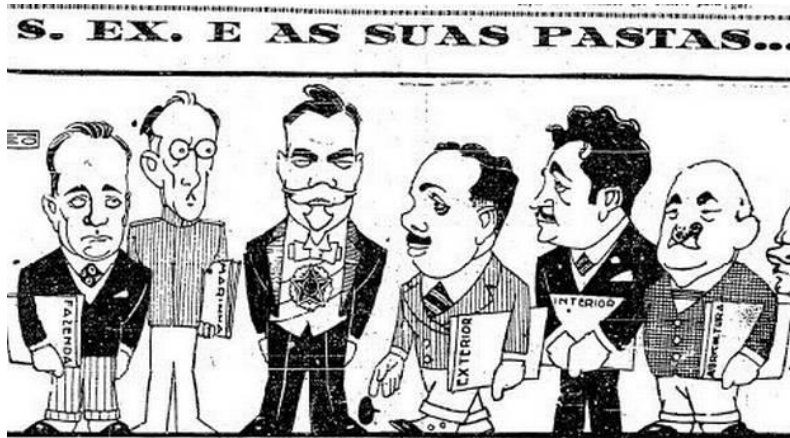
Charge do ministério de Washington Luís, note que na Fazenda estava Getúlio Vargas