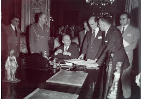
Deposição de Carlos Luz pelo Marechal Lott garantiu a posse de J.K.