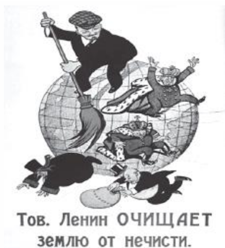
historiaporimagem.blogspot.com.br. Charge de Viktor Denisov (1920) Tradução: "Camarada Lênin limpa a Terra do mal"

A Revolução Russa foi um dos mais importantes eventos do século XX, e os historiadores apresentaram, ao longo do tempo, diversas interpretações sobre os acontecimentos iniciados em 1917. A história do socialismo na Rússia foi movida por uma série de contradições e conflitos, internos e externos, que levaram o país a um determinado modelo de socialismo.